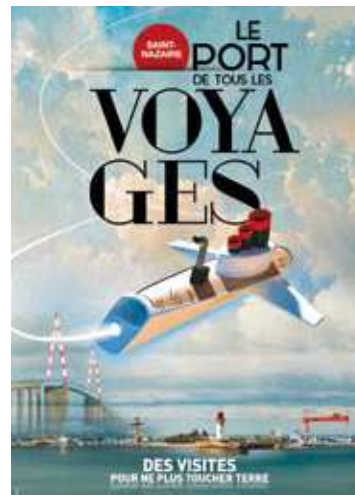
Le Port de Saint Nazaire