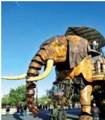
Les Machines de L'Île de Nantes