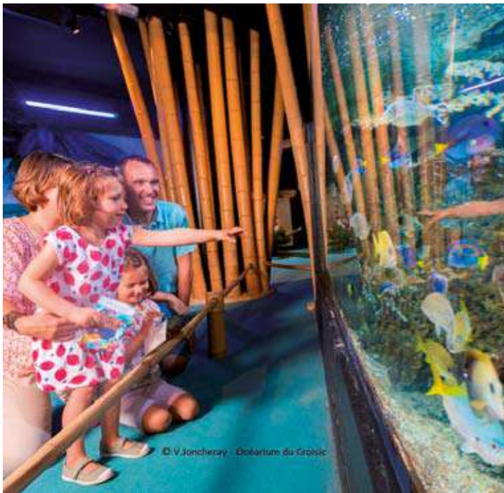
Océarium du Croisic