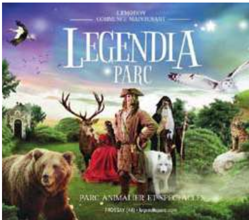
Legendia parc - Frossay