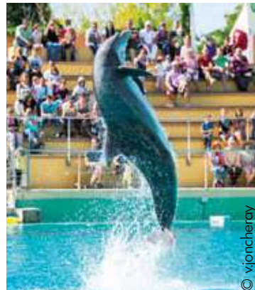
Planète Sauvage à Port St Père