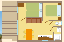
Plan non contractuel

CHALET 1 à 4 places/people/pers. - 2 chambres/bedrooms/slaapkamers