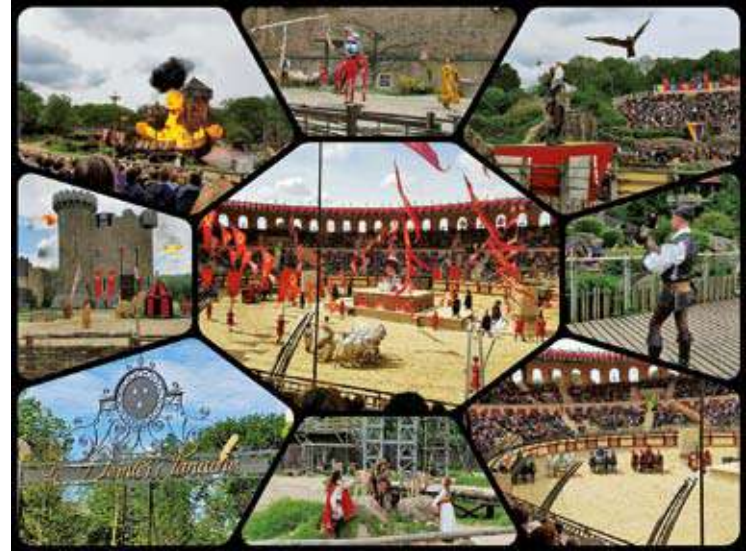
Le Puy du Fou