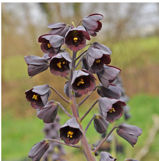
FRITILLARIA persica – Fritillaire de Perse

Légère voyageuse du jardin, cette scabieuse chocolat sombre attire inmanquablement le regard. Se ressème naturellement avec bonheur.