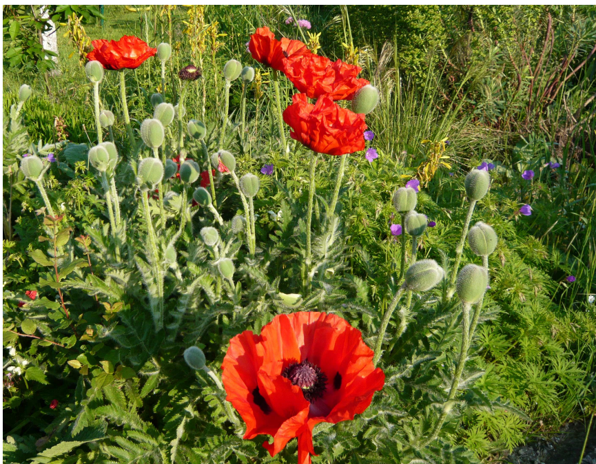
PAPAVER orientale – Pavot d'Orient