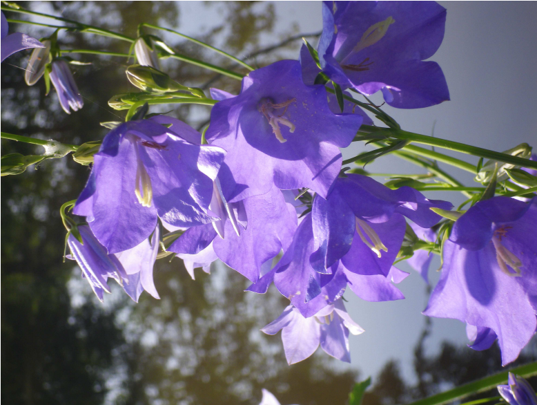
CAMPANULA persicifolia 'Grandiflora Caerulea'