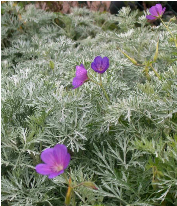
ARTEMISIA 'Powis Castle' - Armoise