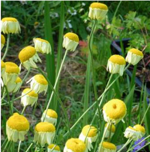
ANTHEMIS tinctoria 'E.C. Buxton'