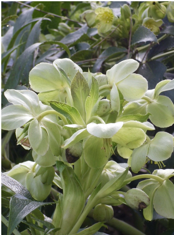
HELLEBORUS argutifolius – Hellébore de Corse