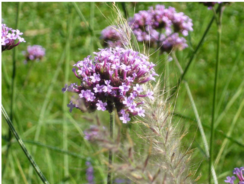
VERBENA bonariensis – Verveine de Buenos-Aires